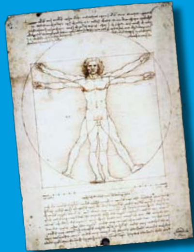
"Vitruviusman" (van Leonardo da Vinci, ca. 1490)

Iedereen kent Leonardo da Vinci (1452-1519), hij mag wellicht het meest veelzijdige genie uit de wereldgeschiedenis genoemd worden. Reeds op jonge leeftijd observeerde hij zijn omgeving, stelde zich vragen, verzamelde informatie, probeerde dingen uit en liet zijn fantasie werken. Hij was architect, uitvinder, ingenieur, filosoof, sterrenkundige, natuurkundige, scheikundige, beeldhouwer, schrijver, schilder en componist.